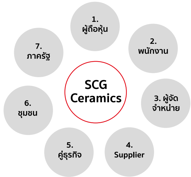
แผนผังผู้มีส่วนได้เสีย (Stakeholder Analysis)

บริษัทได้ตระหนักว่าในการพัฒนาองค์กรให้มีการเจริญเติบโตอย่างมั่นคงและยั่งยืนนั้น นอกจาก บริษัทจะต้องมีการพัฒนาระบบการบริหารและการจัดการภายในองค์กรที่มีความเป็นเลิศแล้ว การจัดการดูแลผู้ที่เกี่ยวข้องกับบริษัทโดยตรง หรือเป็นผู้ที่มีส่วนได้เสีย (Stakeholder) ก็มีความสำคัญเช่นกัน จากการวิเคราะห์ผู้มีส่วนได้เสีย (Stakeholder Analysis) พบว่ามี 7 กลุ่ม ได้แก่ ผู้ถือหุ้น พนักงาน ผู้จัดจำหน่าย ผู้ขายสินค้าหรือวัตถุดิบ (Supplier) คู่ธุรกิจ ชุมชน ภาครัฐ ตามแผนผังผู้มีส่วนได้เสีย